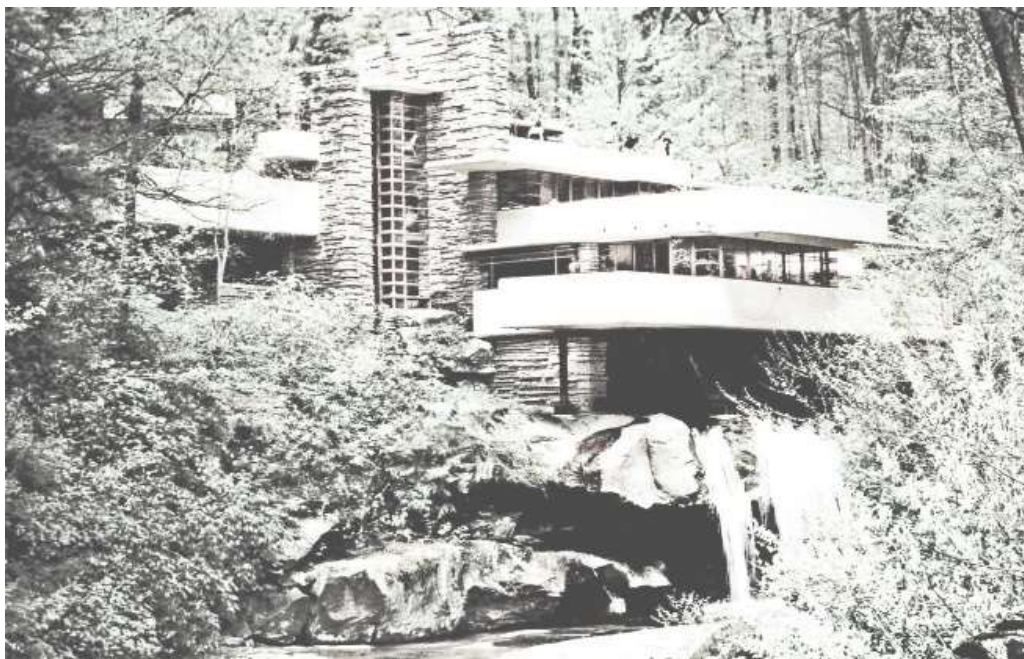
MYND 5.3 – Móta stíl sem eigi sér uppruna t.d. í aðliggjandi náttúru.