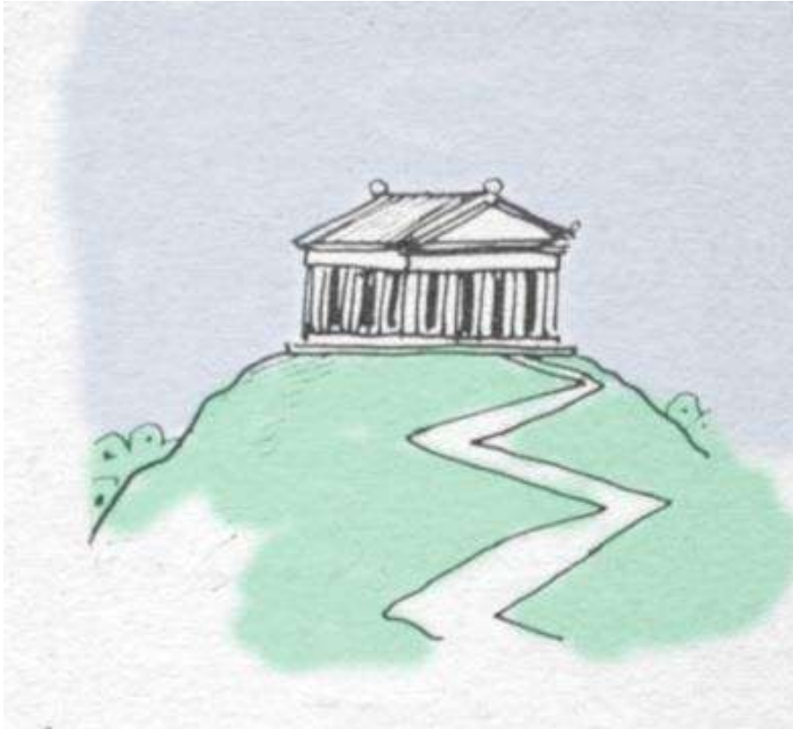
MYND 5.4 – Hanna hús og skipulag svo þau séu þrungið táknað merkingu.