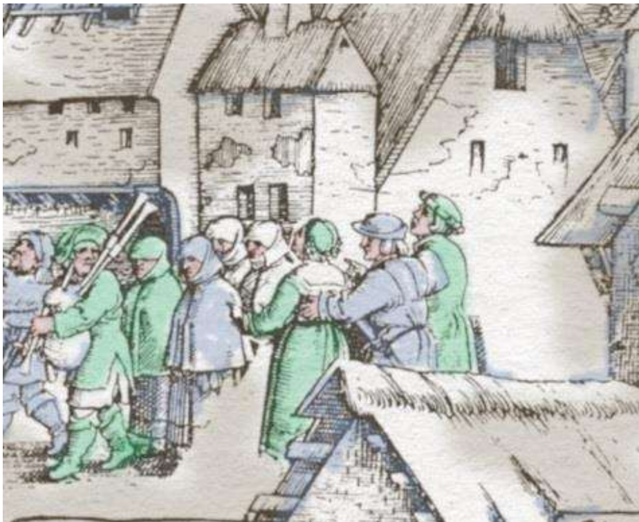
MYND 5.5 – Láta athafnir í húsum og borgum fléttast saman á lífrænan hátt.