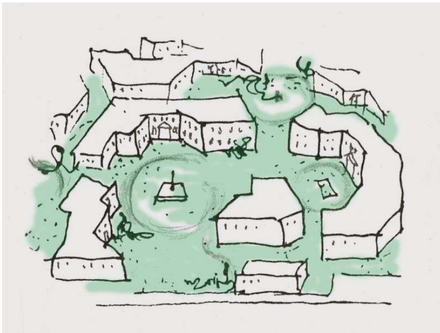
MYND 5.1 – Innleiða þarf skemu og aðferðir sem leiða til tengingar í heildir.